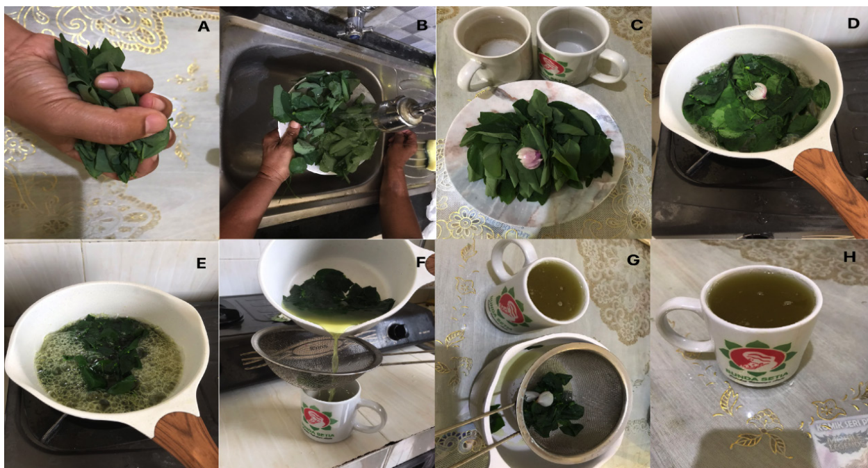
Gambar 1. Proses Pembuatan Rebusan daun Kayu Manis di Kabupaten Gianyar, Bali.

aktivitas antioksidan, sedangkan komponen paling rendah komponen serat ( benzenedicarboxylic acid ) dan silikon ( cyclopentasiloxane ) yang secara umum banyak dikaitkan dengan pencemaran tanaman. 17 Ascorbic acid bersama-sama dengan vitamin E membentuk α-tocopherol dari α-tocopherol radikal di membran sel dan meningkatkan kadar glutathione dalam sel. 18 Efek tersebut membentuk efek penurunan radikal bebas endogen.